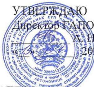
ГРАФИК ПРОМЕЖУТОЧНОЙ АТТЕСТАЦИИ

на 2 полугодие 2023-2024 учебного года специальности 39.02.01 Социальная работа Группа СР-32